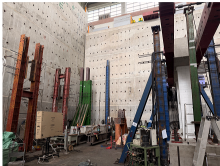
圖 3：國震中心參訪與結構模型觀察