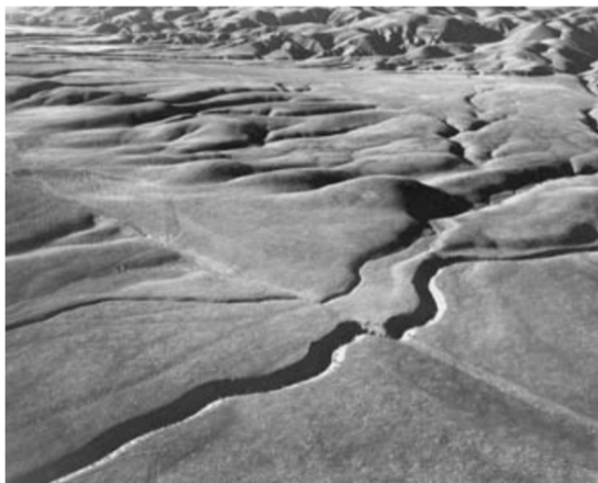
Fig. 4.1-1 Aerial photograph of the San Andreas fault in the Carrizo Plain in California, seen from the south. Note the displacement of stream gullies as the Pacific plate ( near side ) has moved to the left (northwest) relative to North America.