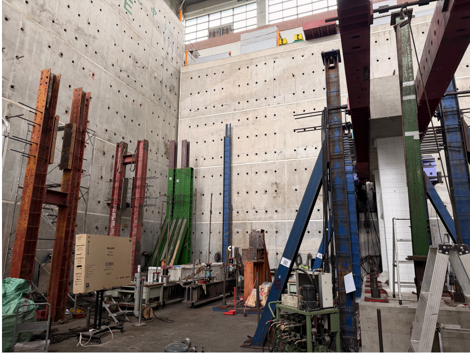
Figure 3: 國家地震工程研究中心參訪紀錄。此圖連結真實結構模型與本專題中的軟弱底層建築模擬。

此圖作為國家地震工程研究中心參訪紀錄，能對應本專題中的軟弱底層建築模擬。透過實際結構模型與網頁中的多自由度剪力建築模型相互對照，可以說明底層剛度不足時，地震能量與層間位移容易集中於底層，進而造成嚴重破壞。