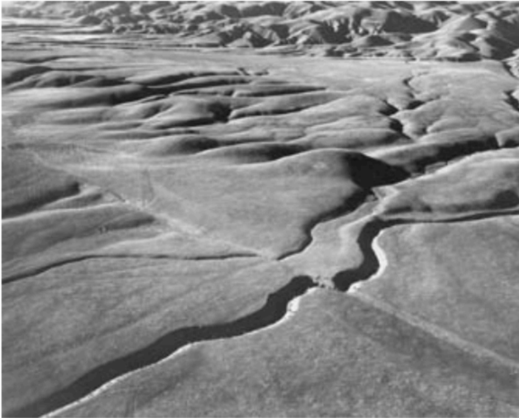
Fig. 4.1-1 Aerial photograph of the San Andreas fault in the Carrizo Plain in California, seen from the south. Note the displacement of stream gullies as the Pacific plate ( near side ) has moved to the left (northwest) relative to North America.

Figure 1: 地震波走時曲線與震央定位互動模組。此圖展示 P 波與 S 波走時曲線，以及透過多測站到時差進行震央定位的動態結果。